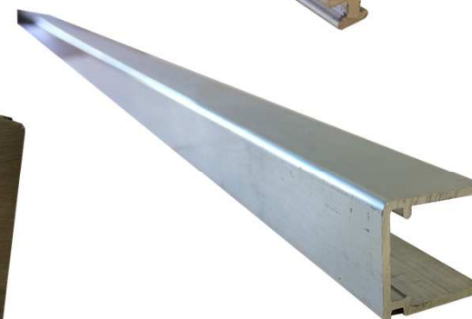
Profilé d'Obturation de plaque