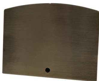
Embout de Profilé